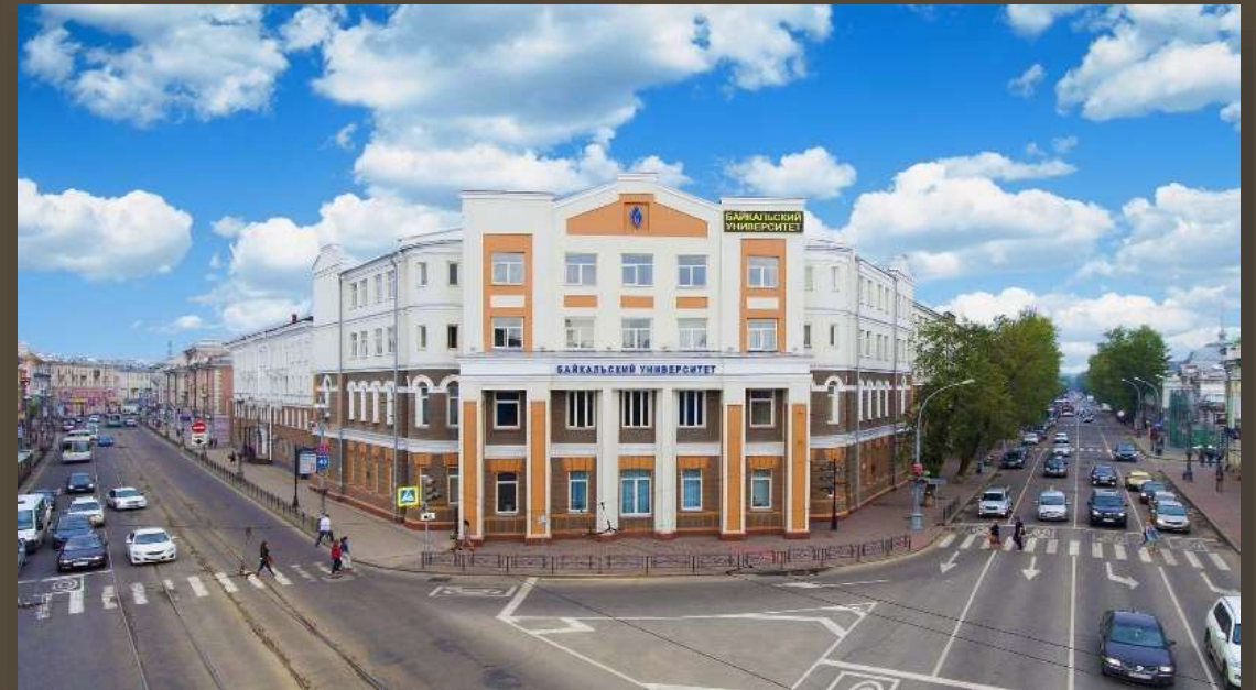
Байкальский государственный университет, 2019 год