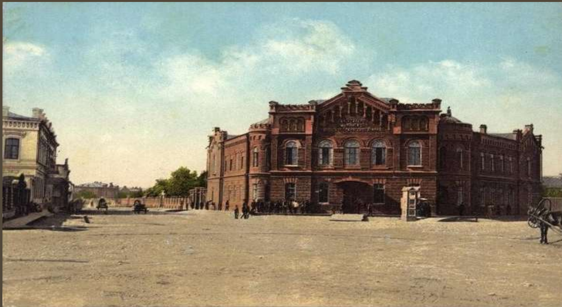
Александрo-Мариинское училище, 1894 год

В 2019 году Байкальскому государственному университету исполнилось 125 лет. Предлагаем вам познакомиться с книгами-ровесниками нашего университета, хранящимися в фонде Научной библиотеки БГУ.